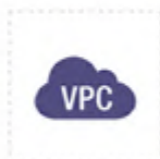
VPC with public subnet