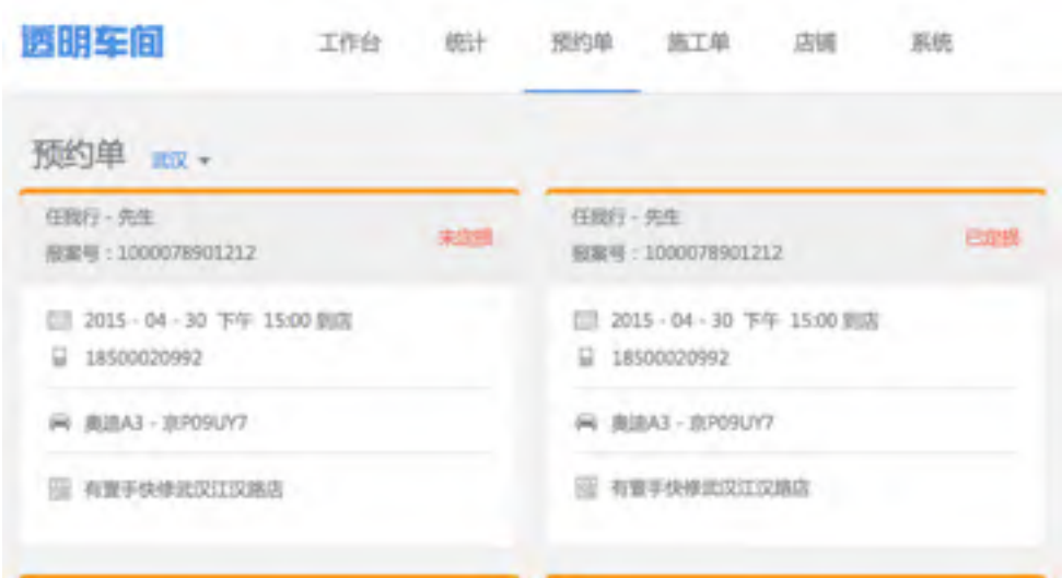
前后台IT系统 电商化