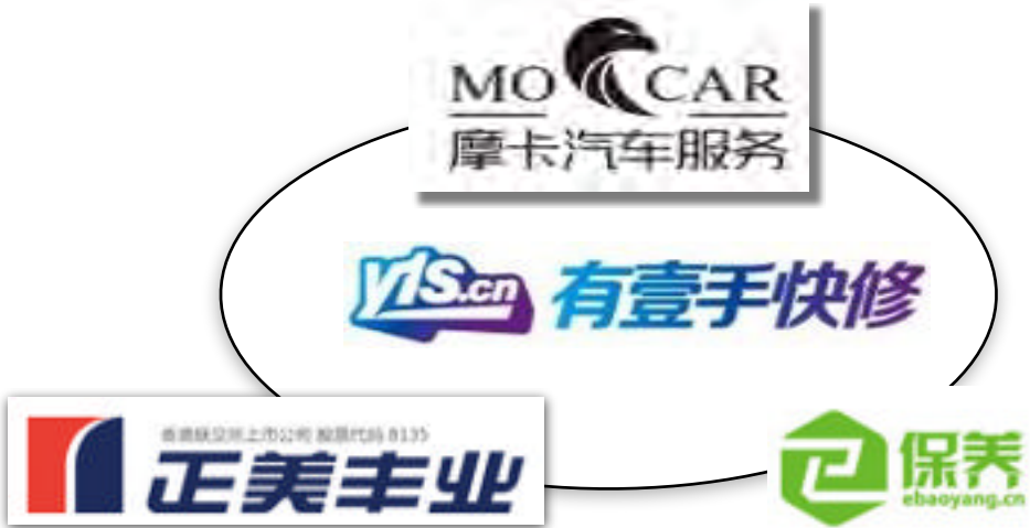
线下服务 生态圈化