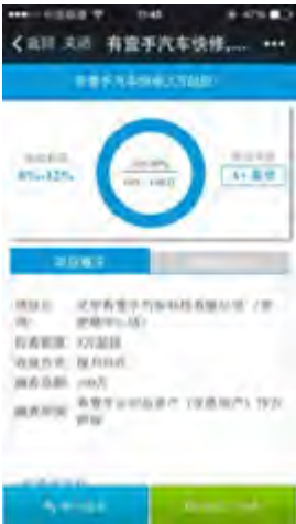
店铺服务和资产 互联网金融化