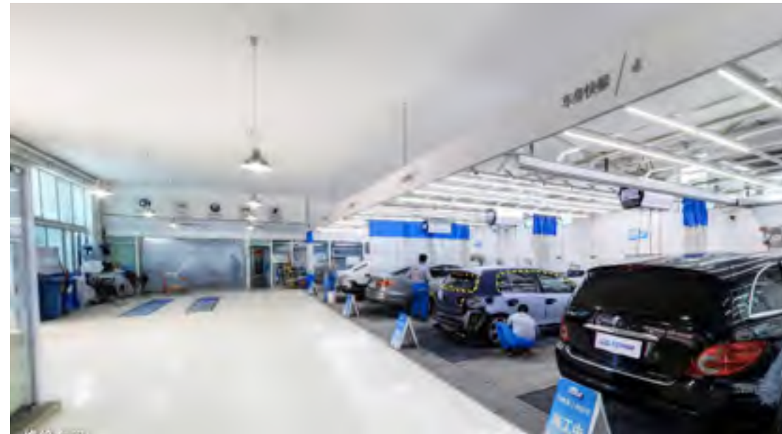
有壹手的线下和线上钣喷车间